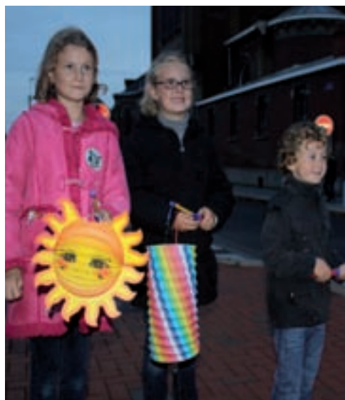
*Petits pots de terre ancêtres du lampion utilisés par les enfants

dans les rues avec vos enfants en accompagnant le cortège ■