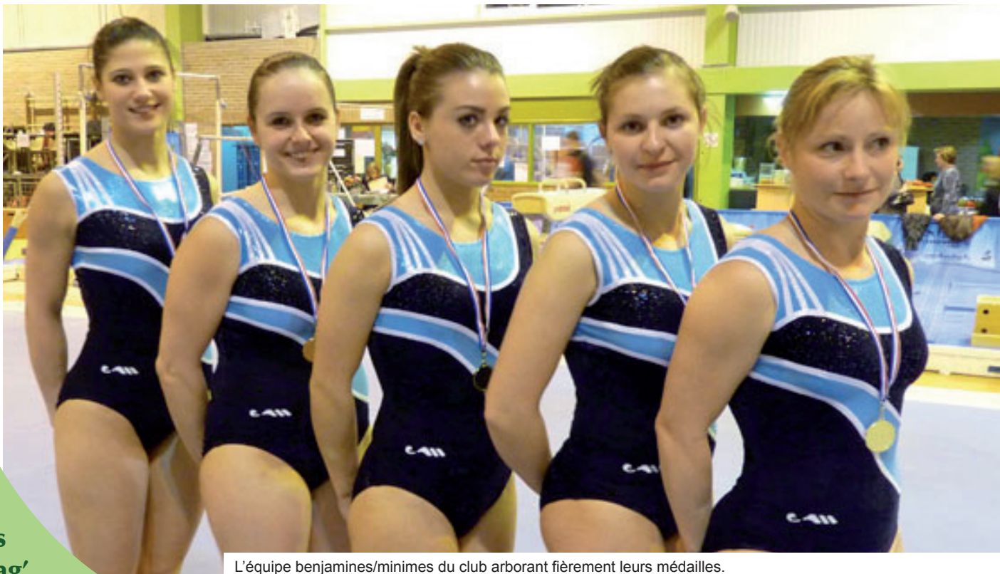
L'équipe benjamines/minimes du club arborant fièrement leurs médailles.

La fosse sera posée à la fin du mois d'octobre pendant la période de vacances de Toussaint. Le coût total de l'acquisition et de son installation s'élève à 27 000 €.