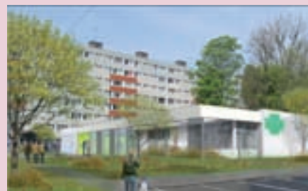
Crédits (de gauche à droite) : Nervures, De Alzua+ et A.Trium Architectes

De gauche à droite : l'aménagement de la voie verte entre la place Faidherbe et la rue Cavrois, la reconversion de l'ancien site S.I.Energie et la création d'un équipement intergénérationnel rue Bacro.