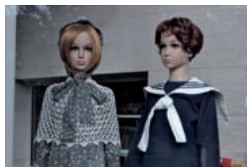
Les deux enfants d'Astruc, le géant Lysois, et de Lise-Lotte de Lotte prénommés «Lylo» et «Hercules»

technique, nous avons remis une borne et des boîtiers permettant de guider les personnes malvoyantes, à l'instar du système installé à la mairie de Lys-lez-Lannoy.