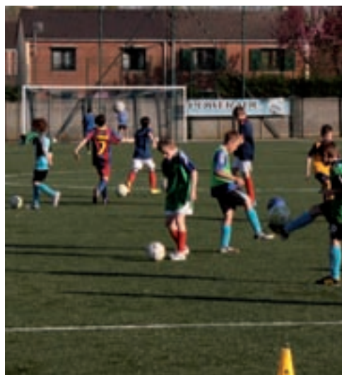
Lys Tennis Echange gagnant

Le tournoi débutera le samedi 11 à 9h30 avec les matchs de qualifications pour le tableau final. Au cours de cette journée, le club d'aéromodélisme «Les 3 ailes de Lys-lez-Lannoy» ouvriront officiellement le tournoi en apportant le ballon du premier match par hélicoptère miniature. L'association proposera